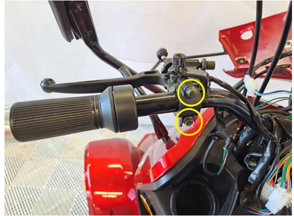
Avaa jarruvivun kiinnityspultit. (hylsy 8 mm).