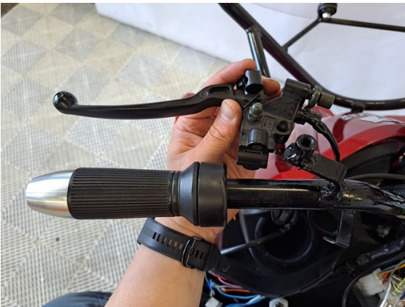
Ota jarruvipu pois paikoiltaan.

Uuden osan asennus käänteisessä järjestyksessä.